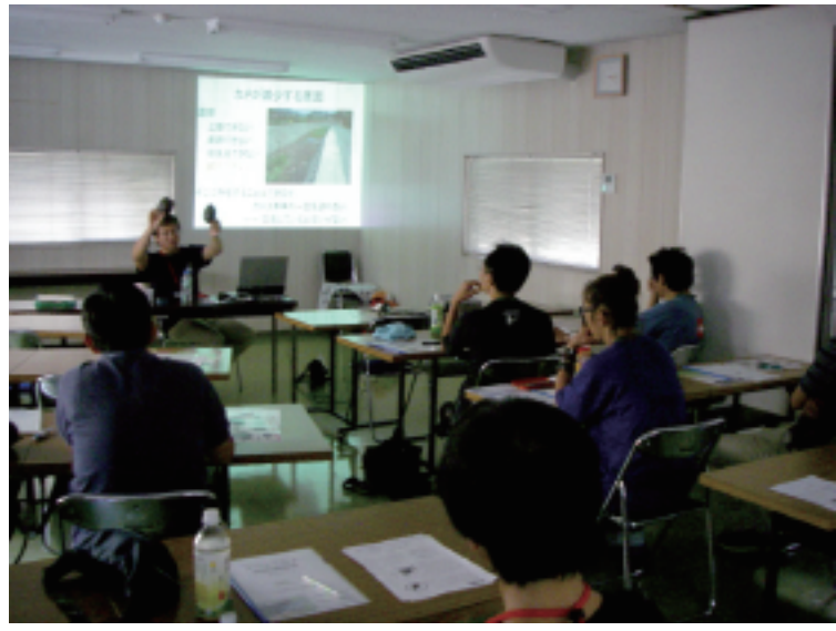
特別講師による講義