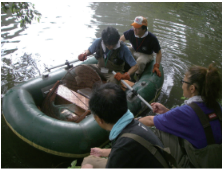
捕獲ワナの設置・回収実習